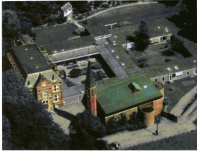
De luchtfoto geeft een beeld van het huidige kloostercomplex waarbij de te restaureren bebouwing in kleur is gemarkeerd.

Het projectteam, bestaande uit (subsidie)adviseurs Hylkema Consultants, architectenbureau Verlaan G Bouwstra, architectenbureau de Vries en Debie & Verkuijl Tuinarchitecten, is zorgvuldig door de opdrachtgever de familie Den Boon samengesteld. Het Masterplan is vanuit de historische context benaderd en is thans goedgekeurd door de gemeente Utrechtse Heuvelrug en de Welstand- & Monumentencommissie. Op 27