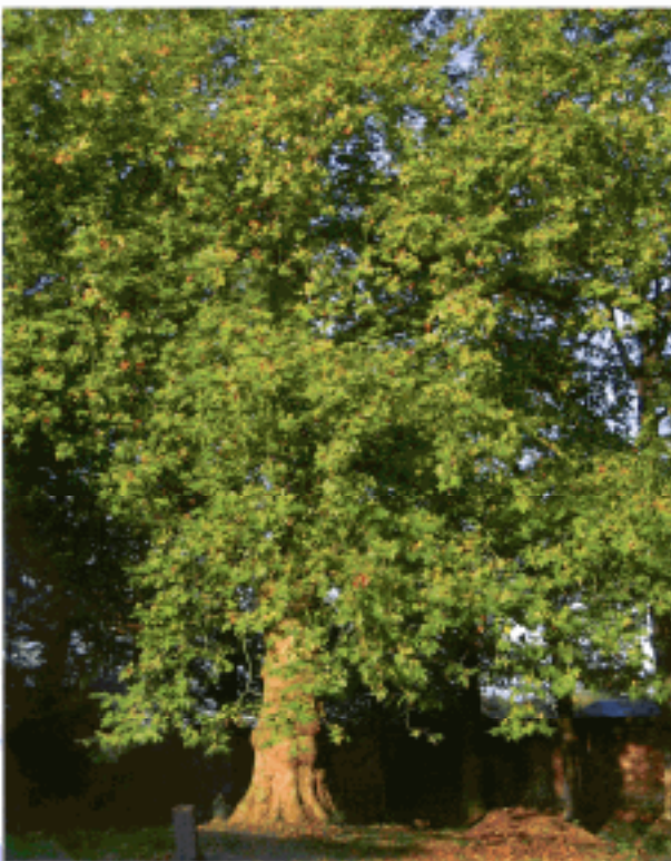
Monumentale plataan uit ca. 1836.