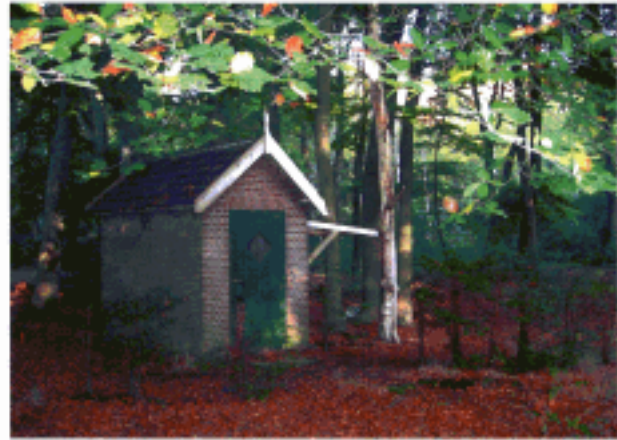
Het originele lijkenhuisje uit ca. 1879 is eenvoudig en sober vormgegeven en behoorde bij de voormalige begraafplaats van Arca Pacis.