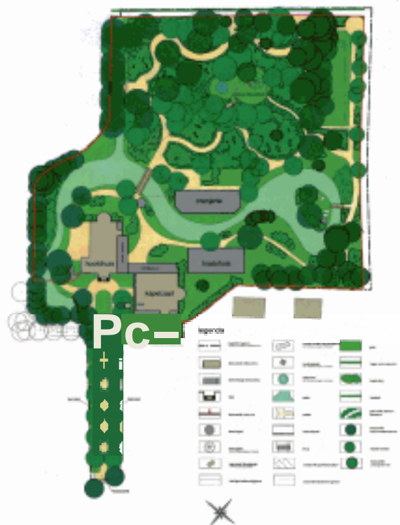
Masterplan restauratie buitenplaats Broekbergen