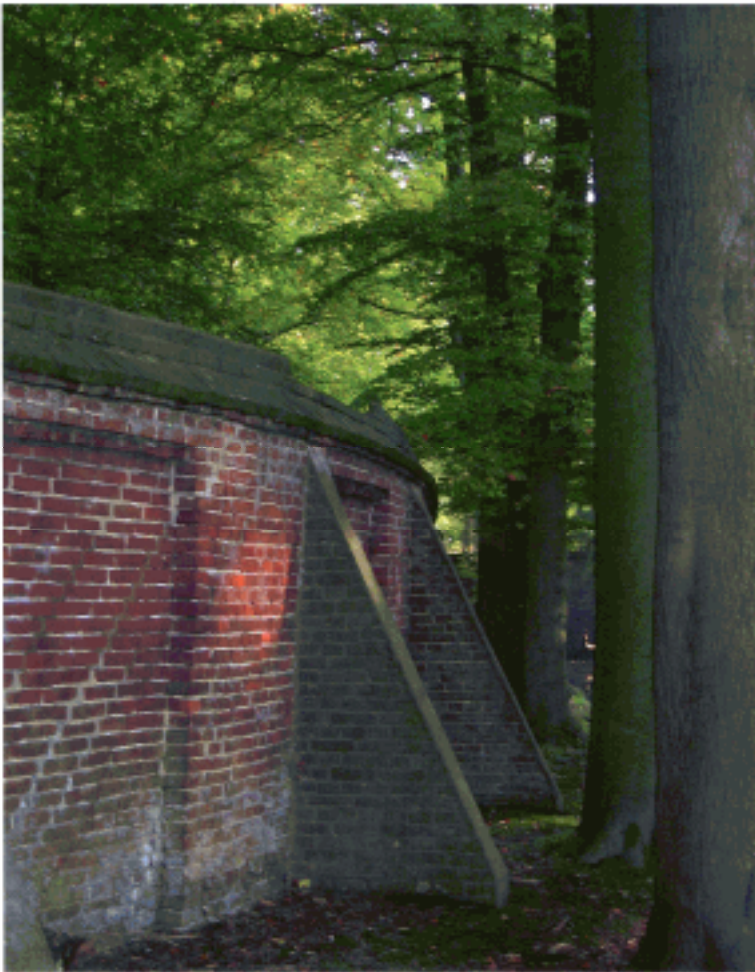
De ommuring van het complex in 1896 was een uiting van de besloten kloosterorde van de achttiende-eeuwse zusterorde Benedictinessen van de Altijdurende Aanbidding uit Bonn-Endenich.